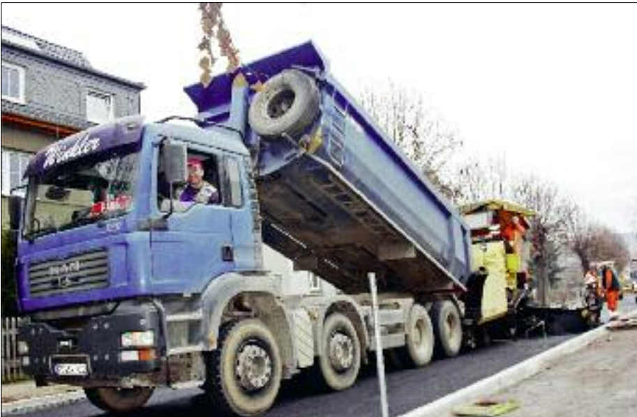
Arbeiter der Chemnitzer Verkehrsbau-GmbH bauen die Schwarzdecke ein.

Wasser- und Abwasserleitungen erneuert. Auf einer Fußweg-Seite erfolgte zudem die Verlegung eines Leerrohres im Auftrag der Telekom. Danach bauten die Arbeiter einen neuen dreischichtigen Fahrbahnbelag ein und sanierten zudem die Fußwege. (kbe)