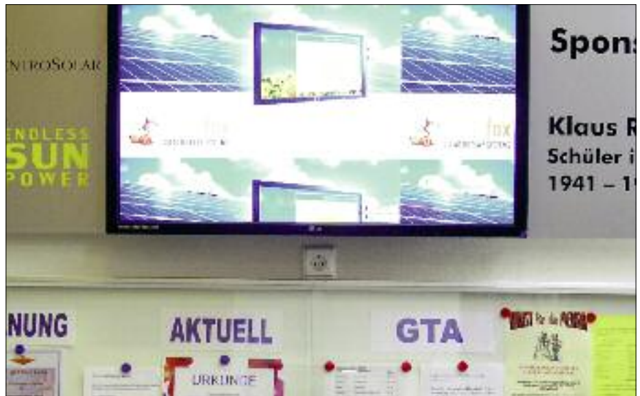
Auf dieser Tafel ist zukünftig die augenblicklich an das Netz abgegebene elektrische Leistung sichtbar.

Lothar Schreiter ergänzte mit Fakten aus dem Kirchenarchiv die Glockengeschichte. Der erste schriftliche Nachweis über zwei Glocken stammt aus dem Jahr 1565. Dass beim Besuch des Kurfürsten geläutet wurde, ist aus einer Eintragung